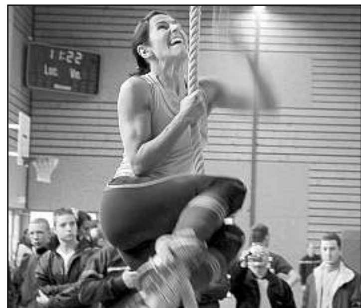
Des épreuves soutenues pour décrocher une place pour la finale régionale le 24 mai à Nancy.